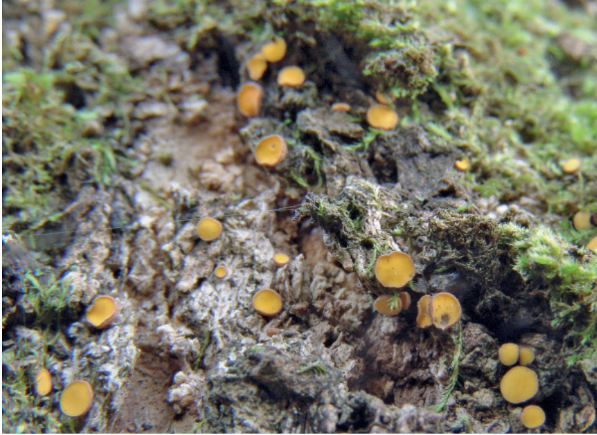
Abb. 14: Lachnum indicum (geselliges Wachstum an Rinde)