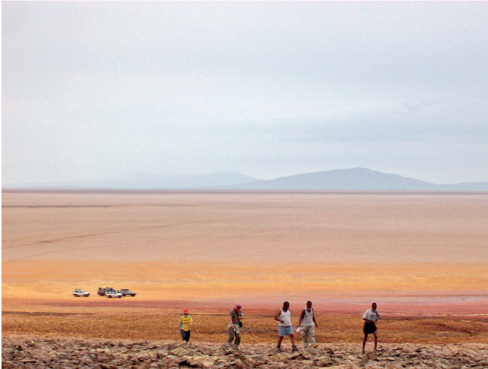
Abb. 5: Blick auf die Danakilwüste in Ost-Äthiopien