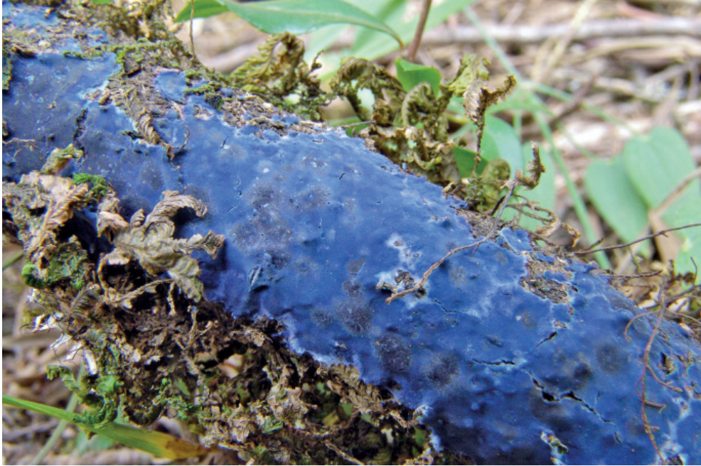
Abb. 20: Terana coerulea