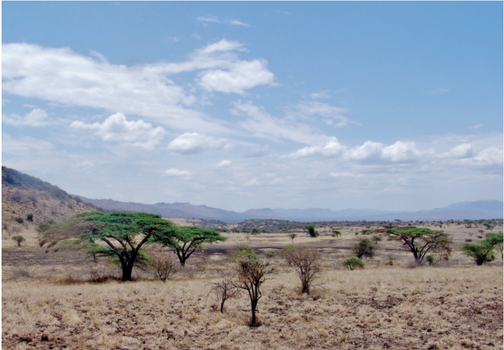
Abb. 4: Savannenlandschaft mit Schirmakazien ( Acacia abyssinica Benth.) bei Arba Minch in Süd-Äthiopien, ca. 1200 m ü. NN