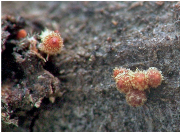
Abb. 16: Lanatonectria flocculenta

Obwohl die Perithezien von Lanatonectria flocculenta winzig sind (Durchmesser 0,2-0,3 mm), ist die Gattung, zu der die Art gehört, schon makroskopisch gut ansprechbar. Die goldenockergelblichen Haare, welche die Perithezien umgeben, sind einzigartig unter den Arten aus der Familie der Nectriaceae Tul. & C. Tul. und kennzeichnen alle Taxa aus der Gattung Lanatonectria Samuels & Rossman (ROSSMAN ET AL.