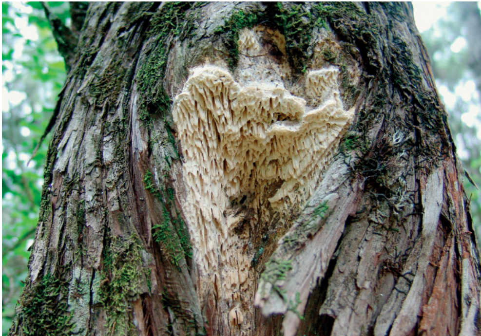
Abb. 8: Antrodia juniperina