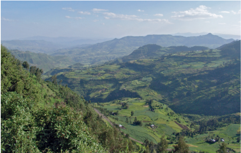
Abb. 2: Hochgebirgskulturlandschaft nahe der alten äthiopischen Königsstadt Ankober in Nordost-Äthiopien; Höhe der fotografierten Bergrücken etwa 3.200 - 3.300 m ü. NN