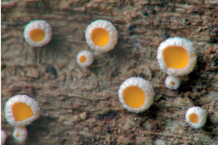
Abb. 13: Lachnum brasiliense