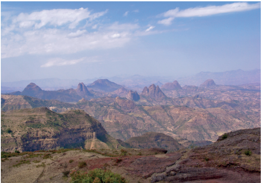
Abb. 3: Ausläufer der Simien-Mountains in Nord-Äthiopien, Höhe der Berge bis etwa 3.500 m ü. NN