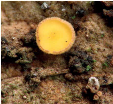
Abb. 15: Lachnum indicum (Einzelfruchtkörper)