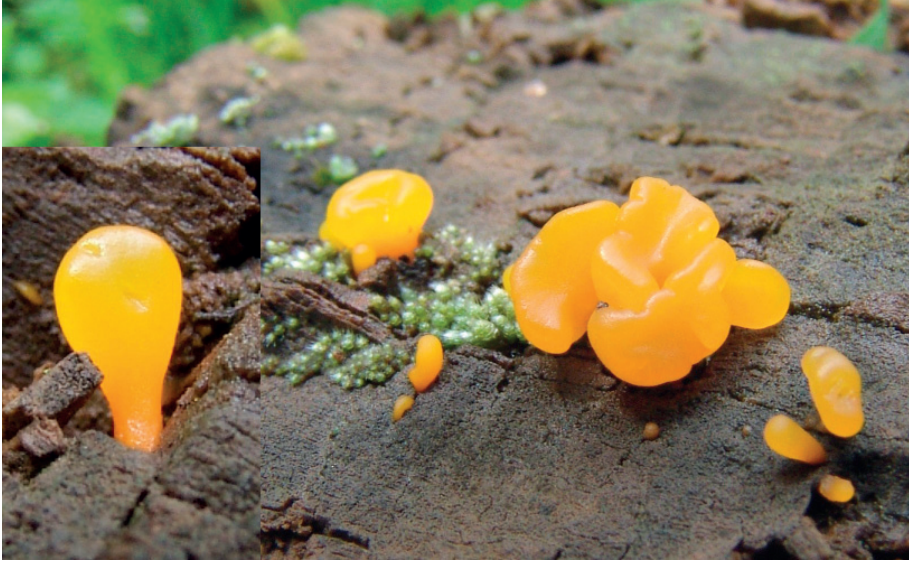
Abb. 10: Dacryopinax spathularia