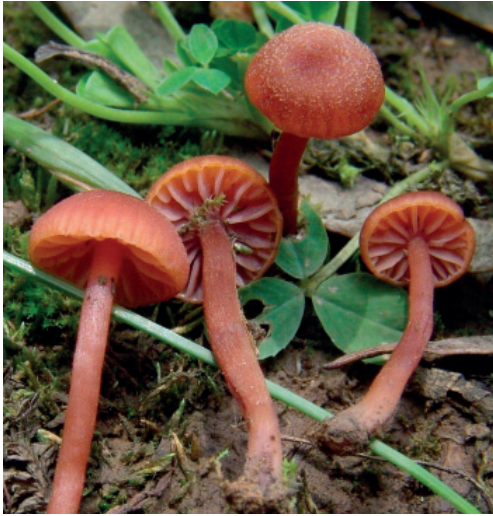
Abb. 12: Laccaria lateritia

bei L. lateritia die Sporen zwar bis max. 11,5 µm groß werden können, aber der Durchschnittswert immer um bzw. unter 10 µm liegt (alle Maße ohne Stacheln). Die Maße der äthiopischen Aufsammlung sind 8,5-11,5 x 8,5-11 µm (im Durchschnitt 10 x 9,75 µm). Nimmt man die angeführten Merkmale zusammen, kann die äthiopische Laccaria -Aufsammlung mit einiger Wahrscheinlichkeit als L. lateritia angesprochen werden.