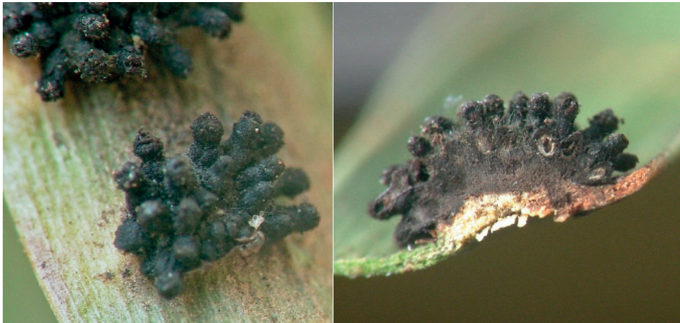
Abb. 9: Corynelia uberata (Fruchtkörper auf Blatt von Afrocarpus falcatus mit Schnittbild)