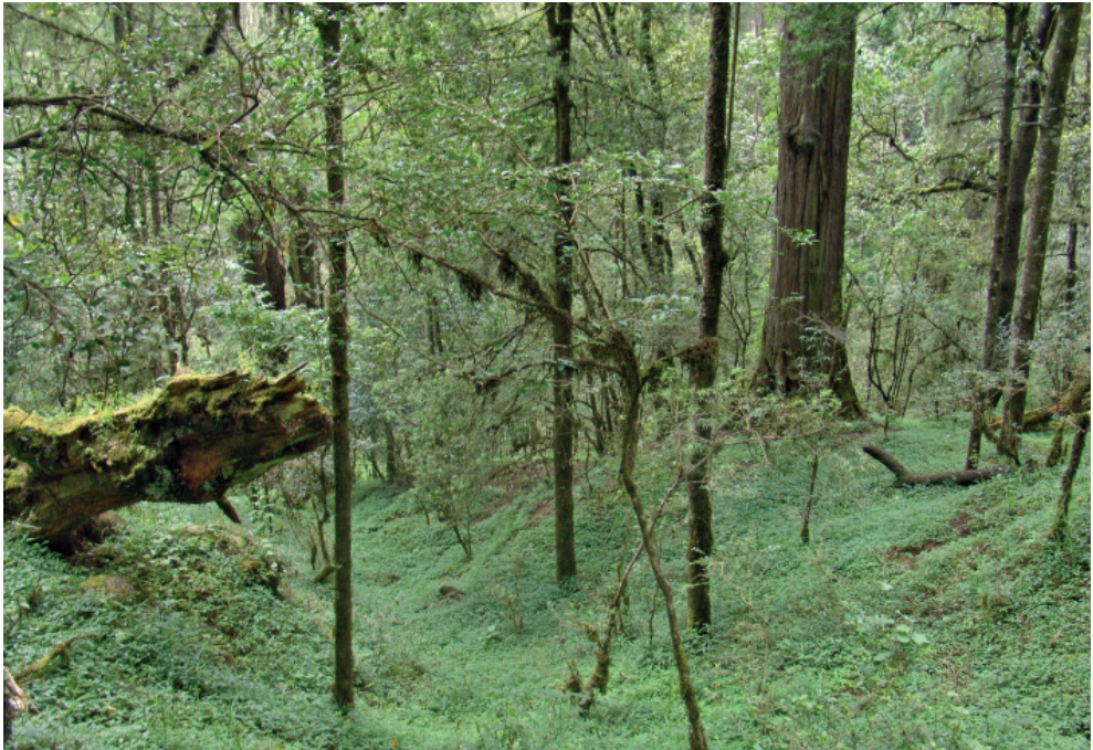
Abb. 1: Menagesha Suba State Forest: subtropischer Wald in afroalpiner Höhenstufe, ca. 2.500 m ü. NN

Vergleichsweise ursprüngliche Biotope gibt es in Äthiopien nur noch in den geschützten Zonen der Naturreservate und Nationalparks oder in entlegenen Wüsten-, Savannen- und Hochgebirgsregionen, die dünn besiedelt und verkehrstechnisch wenig erschlossen sind. Wegen der vielen anderen Probleme, die das Land hat, existiert in Äthiopien kaum ein ökologisches Bewusstsein. Zwar gibt es in manchen Regionen erste, meist von Europäern initiierte Versuche eines Ökotourismus, der auch der ortsansässigen Bevölkerung zugute kommt. Aber diese Ansätze sind an den Fingern einer Hand abzuzählen. So faszinierend die Natur des Landes ist, so sehr ist sie gleichzeitig durch einen – nicht zuletzt durch industrielle Interessen forcierten – Raubbau an der Natur gefährdet, der schon jetzt große Teile des Landes verödet hat.