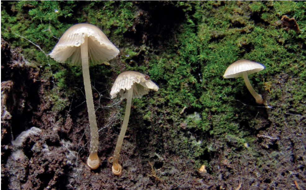
Abb. 17: Mycena fumosa