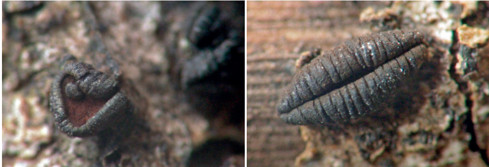
Abb. 19 a, b: Rhytidhysteron rufulum (a: geöffneter b: geschlossener Fruchtkörper)