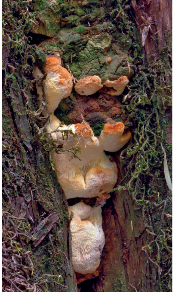
Abb. 18: Pyrofomes demidoffii

Neben Antrodia juniperina ist Pyrofomes demidoffii die zweite Porlingsart, die man an lebenden, alten Bäumen von Juniperus procera finden kann. Beachtet man das Substrat, lassen die großen, farblich markanten Fruchtkörper kaum eine Verwechslung mit anderen Porlingsarten zu. Junge Fruchtkörper sind im Gegensatz zum abgebildeten mehrjährigen jedoch noch vollständig gelb und nicht in Hutzone und Poren differenziert. Ähnlich wie A. juniperina bricht P. demidoffii aus den Längsspalten der Borke hervor. Die Art verursacht jedoch keine Rot-, sondern Weißfäule. A. juniperina und P. demidoffii sind die einzig bekannten Pilze, die lebende Bäume von J. procera befallen können (vgl. RYVARDEN & JOHANSEN 1980: 532; HÄRKÖNEN ET AL. 2003: 167; VLASÁK 2011). In BERNICCHIA (2005: 481) wird P. demidoffii zwar kurz erwähnt, aber im Gegensatz zu den üblichen Gepflogenheiten des Bandes ohne genauere Maßangaben nur in Italienisch beschrieben.